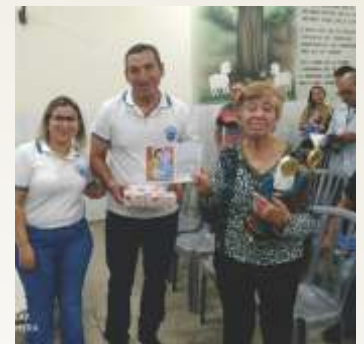
Pastoral Familiar da Paróquia Vila Fátima